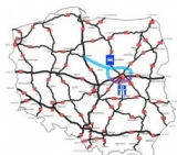
Autostradowa obwodnica Warszawy ma przebiegać przez teren Powiatu Legionowskiego.