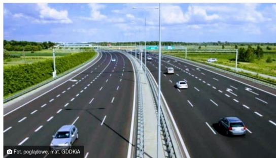
Fot. poglądowe. mat. GDDKiA

Udostępnij Facebook Twitter LinkedIn Udostępnij przez e-mail Drukuj